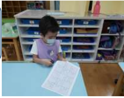
富恩很認真的用剪刀嘗試拼圖的方塊