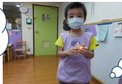
富恩拿到乒乓球可以打乒乓球