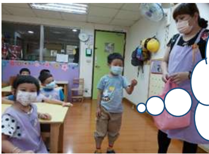
晉愷拿到彈珠猜出來夜市市的彈珠台