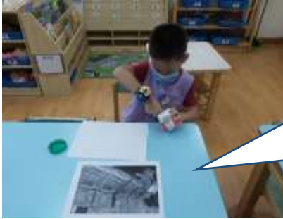
杰凱很專注如何兩張紙黏貼好對齊