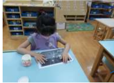
羽汝很專注將兩張紙黏貼和對齊