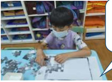
可恩很認真很專注剪工很熟練和拼圖