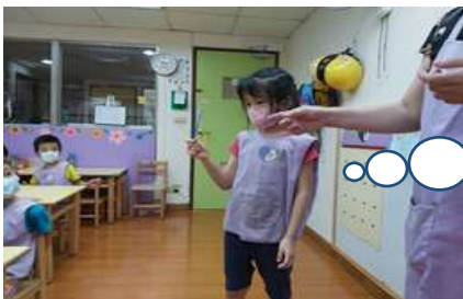
羽汝拿到繩子和棒子想出可以釣魚