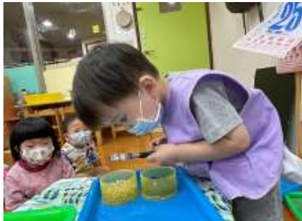
宥鈞 拿放大鏡觀察低頭仔 細看黃豆