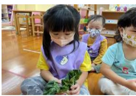
宥涵 剝開看看有什麼