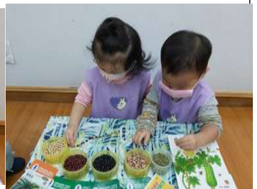
奕心 排毛蟲 煦岳 一起看看和排排看