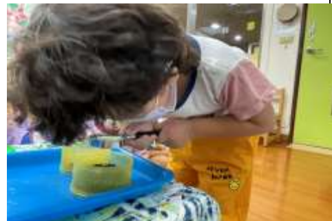
崇恩哇!好認真拿放大鏡觀 察