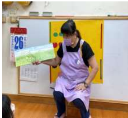
今日老師分享繪本故事

《小蠶豆和好長好長的豆子》和小蠶豆一起學競爭成長，這次的故事，是從小蠶豆和朋友們在草地上發現了一條「怪東西」開始的。他們試著拉一拉那個怪東西！從長菜豆兄弟覺得自己的床最棒；小蠶豆和他的朋友們卻覺得小蠶豆的床最棒。於是他們展開了一場又一場的比赛，到底誰會贏了比赛呢？故事裡其實，是再說每一個小朋友都有比較的心理，但是他們的心情很單純，有時會因為一時的不愉快而傷心，有時也會只因為「想要幫忙」的心情就成為朋友，這是連三歲幼兒都能看懂的，孩子們化敵為