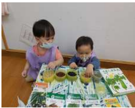
宥鈞 承爵我們摸摸看