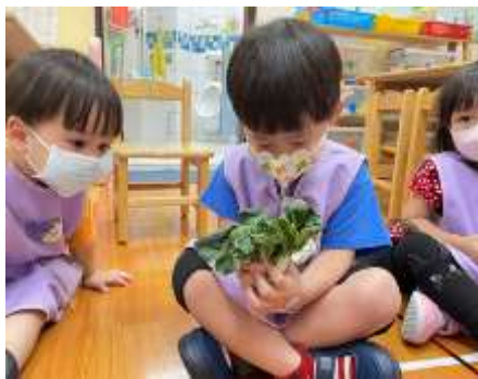
曦云 似乎看見葉脈