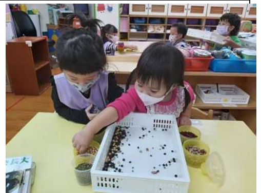
芯怡 若綾豆子打翻囉~我們來分類