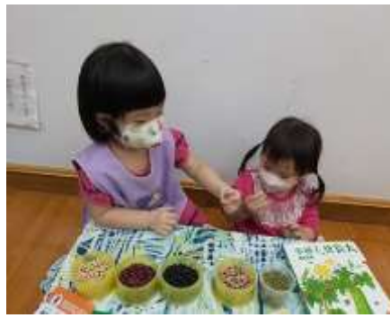
語菡 若綾看哪個豆子比較大和比較小