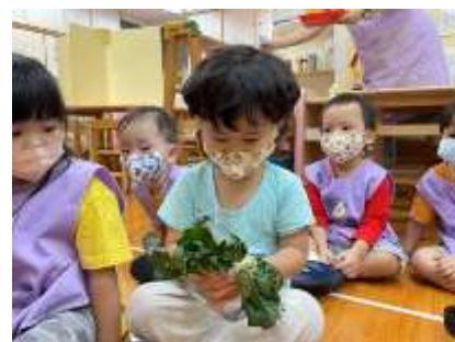
崇恩 噢~很葉子很綠