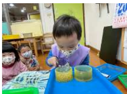
承爵拿放大鏡觀察看綠豆

今日主題活動延續 10/24 『菜籽寶寶』老師先準備布丁杯和盤子/水，先將種子撒在盤子裡再利用放大鏡讓寶貝們去實際觀察小種子的形狀，老師採用了圖片和蔬菜結合的方式，讓小朋友更直接、更真實的觀察蔬菜的種子，並讓他們運用前面已有的經驗說一說，對蔬菜又有更進一步的認識。